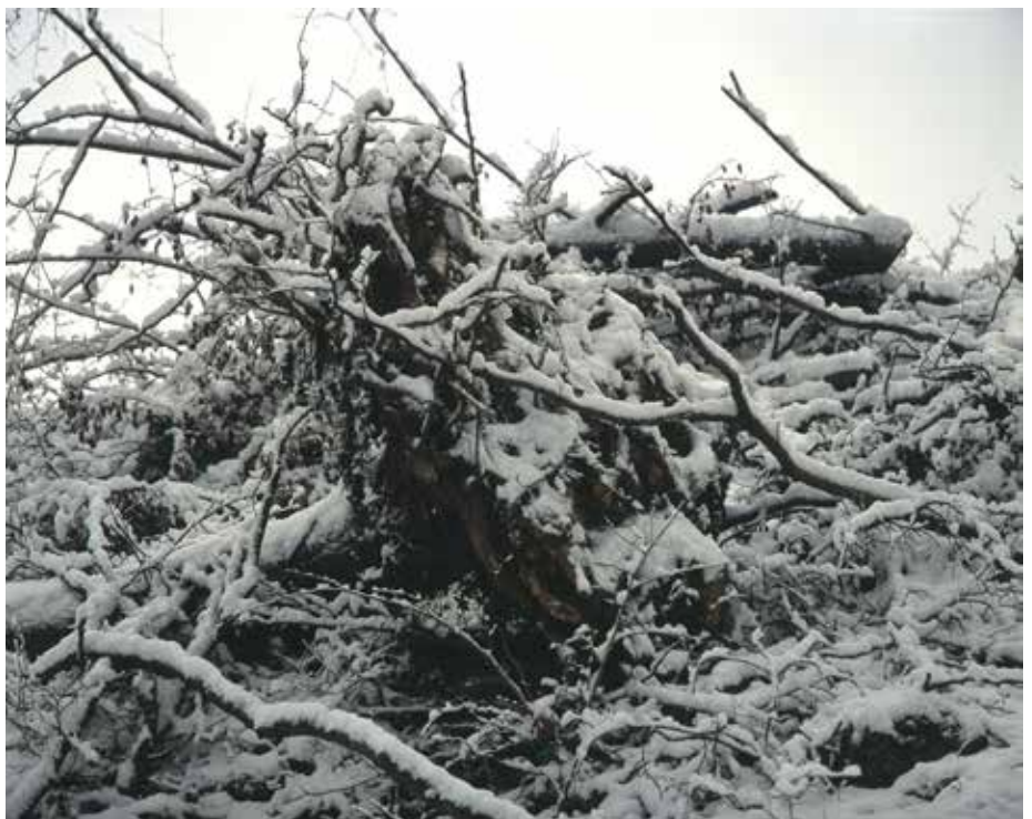
↗ Jean Luc Tartarin, de la série Entre(s) , 2012, tirage type C Digital