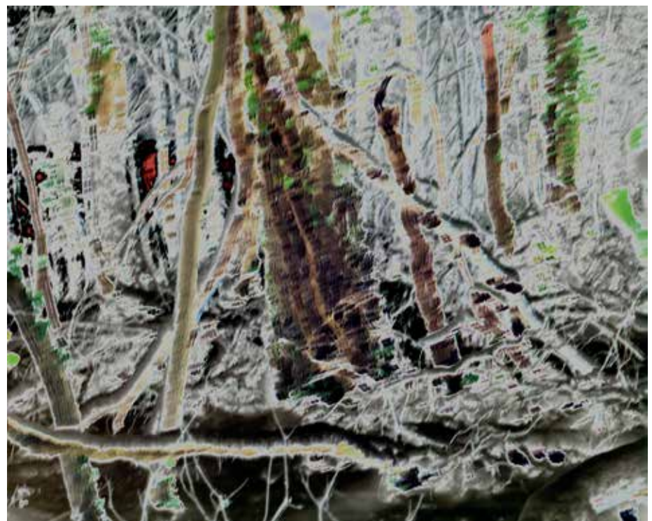
↗ Jean Luc Tartarin, de la série Entre(s) , 2013, tirage type C Digital © Jean Luc Tartarin